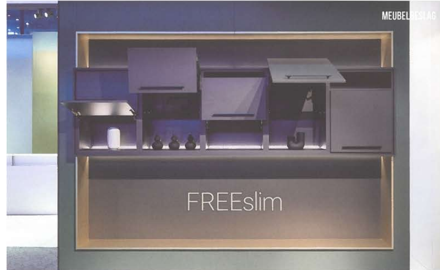
De klep blijft in elke gewenste stand openstaan en beweegt niet verder dan de gebruiker wil.

Tekst: Tamara Brouwers