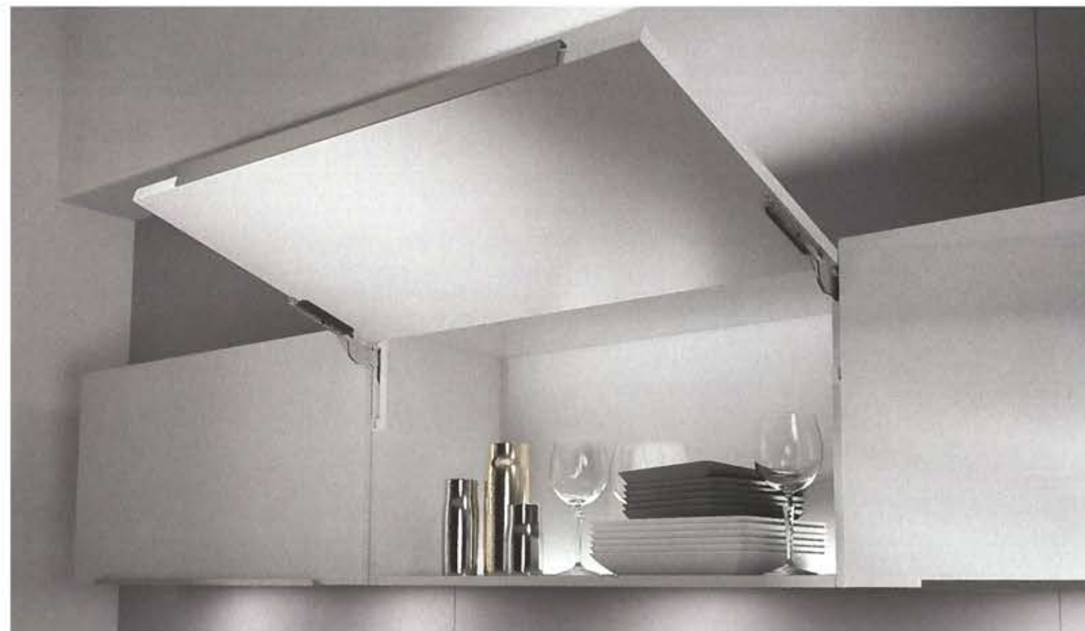
FREEslim flap werd ontwikkeld voor hoge kasten en biedt maximale vrijheid bij montage.